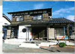
小規模多機能ホーム きやま虹の家

地域に密着した福祉の拠点づくりと、きめ細かな福祉サービスの提供を目指し、地域のみなさまとともに小規模多機能ホームを運営しています。