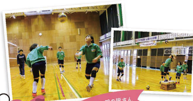
三方中学校バレーボール部の皆さん