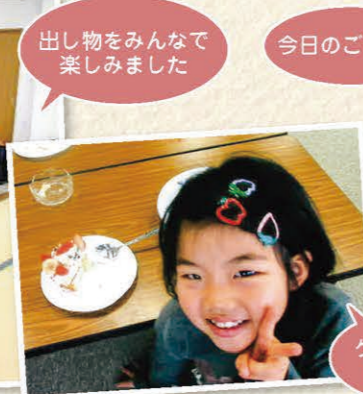
出し物をみんなで楽しみました