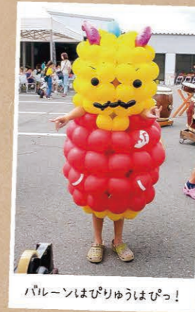
バルーンはぴりゅうはぴっ!

もっといろんな人にバルーンアートのことを知ってもらって、たくさんの方が私のバルーンアートを見て笑顔になってほしいです。風船はゴム風船だけじゃないですよ!