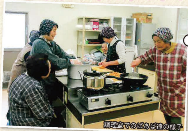
調理室でのあば達の様子

また、保護者の方々とあば達も強いつながりを持つことができ、孤立することなく気軽にお話しすることができうれしい限りです。今後ともどうぞよろしくお願いいたします。