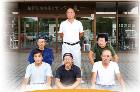
ボランティアの方々ありがとうございました

8月25日(日)、三方建築業組合のボランティアによる家屋補修が実施されました。町内三方地域に在住のひとり暮らし高齢者等を対象に、生活する上で最低限必要な家屋の補修を行うことで、安心安全に生活をしていただくことを目的として行いました。