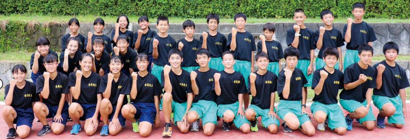
三方中学校陸上部の皆さん