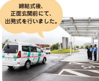
締結式後、正面玄関前にて、出発式を行いました。