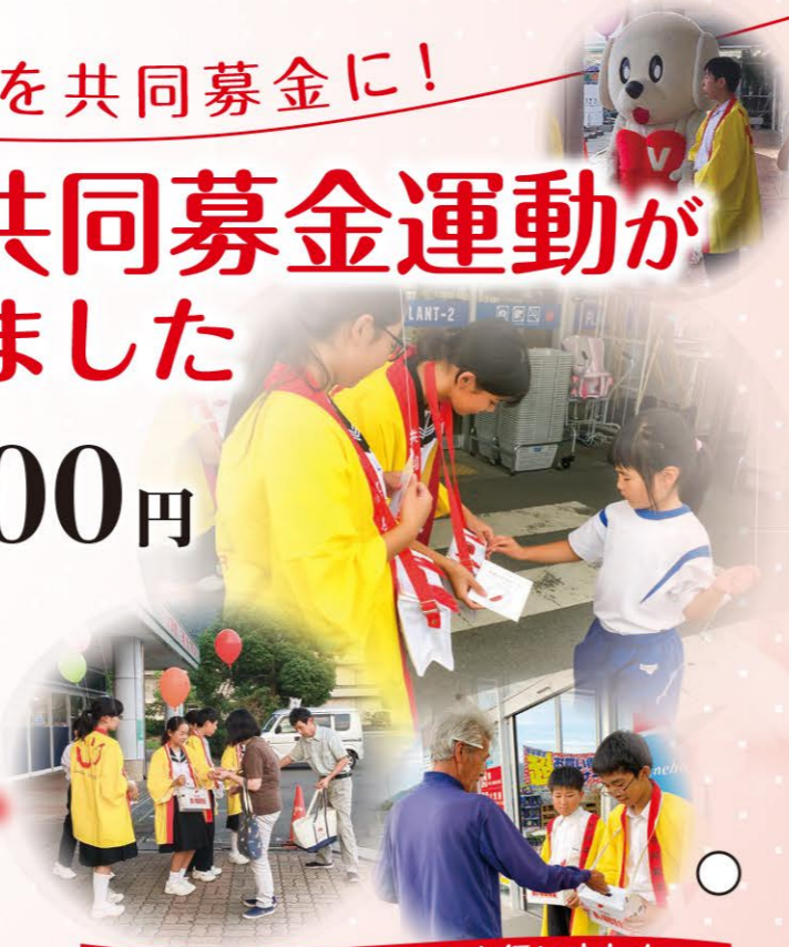
10月1日に街頭募金を行いました