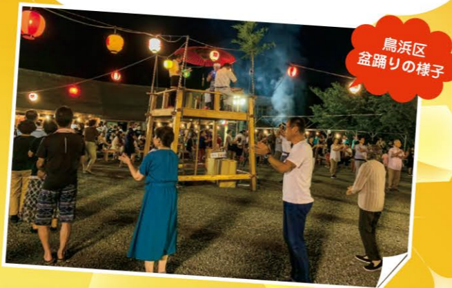
鳥浜区 盆踊りの様子