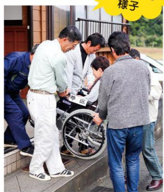
気山区芋 避難訓練の様子

集落内のコミュニケーションの希薄化が感じられることから、各種団体(子ども会・青壮年会・女性の会・老人会など)の枠を超え、区民による無理のない継続した事業・イベント等の企画・実施をしたいです。