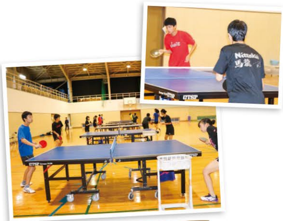
美方高校卓球部の皆さん