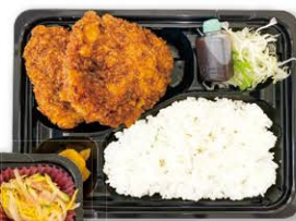
ソースカツランチ