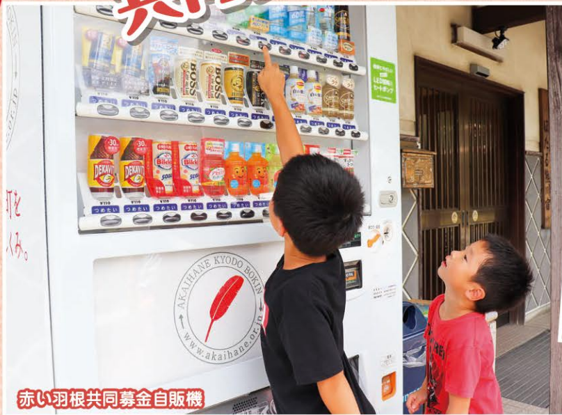
赤い羽根共同募金自販機