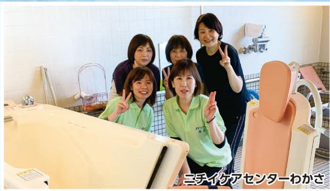
ニシキケアセンターわかさ