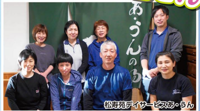
松寿苑デイサービスあ・うん