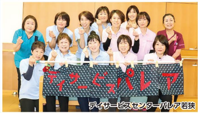
デイサービスセンターパレア若狭