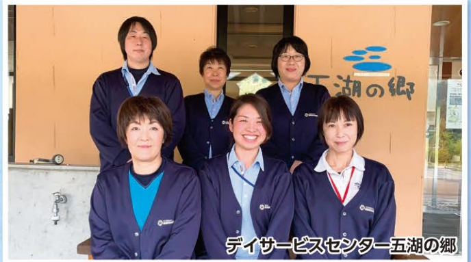
デイサービスセンター五湖の郷