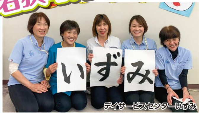
デイサービスセンターいずみ