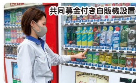
共同募金付き自販機設置