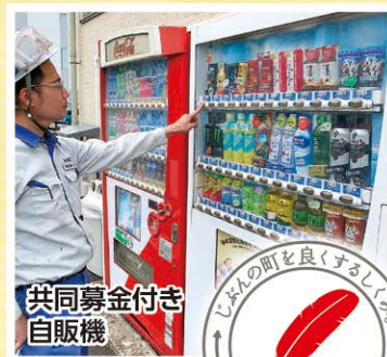
共同募金付き 自販機