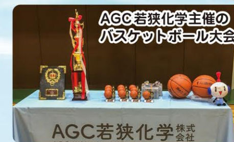
AGC若狭化学主催のバスケットボール大会

学生のスポーツ活動・クラブ活動を応援しています。(吹奏楽演奏会・高校ラグビー・少女バレーボール等)