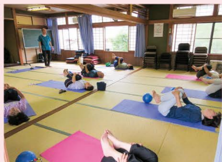
藤井健康づくりの会 講師による健康体操教室

※今年度ご協力いただきます共同募金の一部を活用し、令和4年度に助成させていただきます。