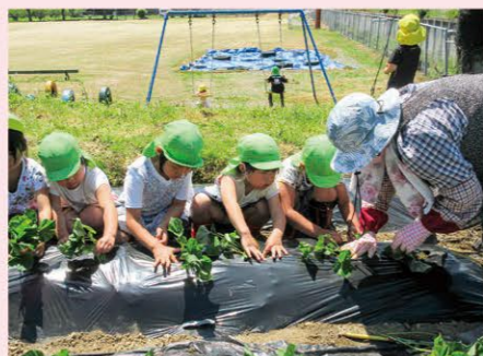
社会福祉法人西田福祉会 梅の里保育園 菜園を通じた世代間交流