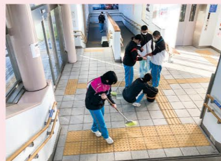
若狭町立上中中学校 JR上中駅にて清掃活動