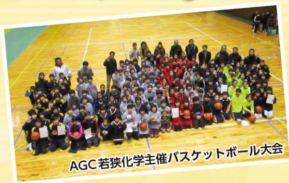
AGC若狭化学主催バスケットボール大会