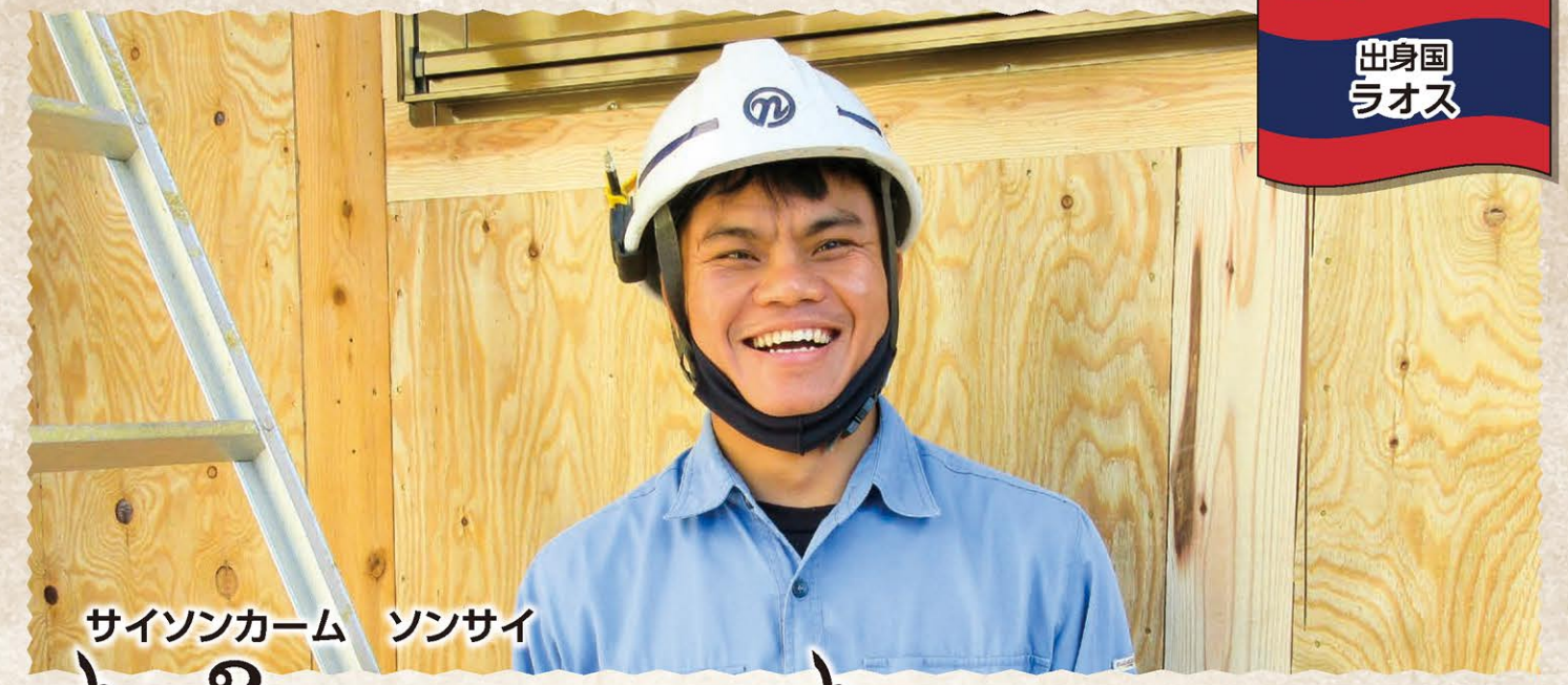
サイソンカーム ソンサイ