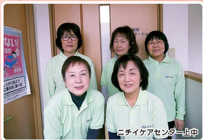
ニチイケアセンター上中