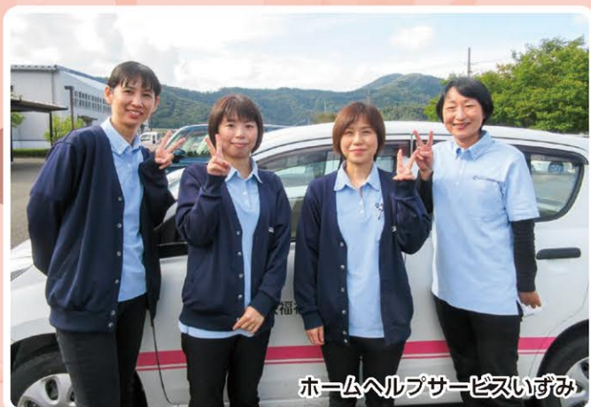
ホームヘルプサービスいずみ