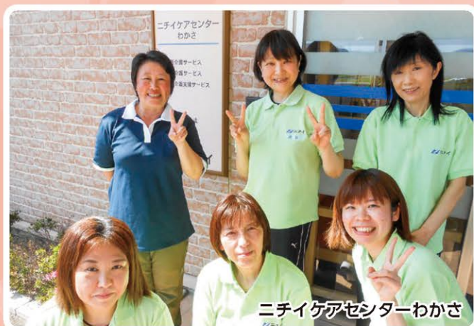
ニチイケアセンターわかさ