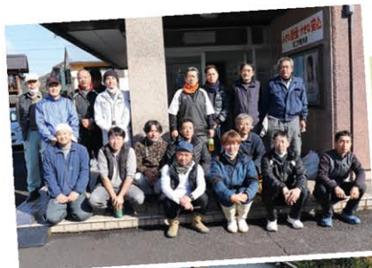
上中建築組合 ボランティア のみなさん