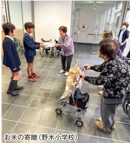
お米の寄贈(野木小学校)