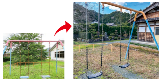
神谷区(ブランコ修繕)