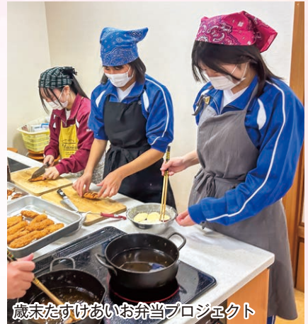
歳末たすけあいお弁当プロジェクト