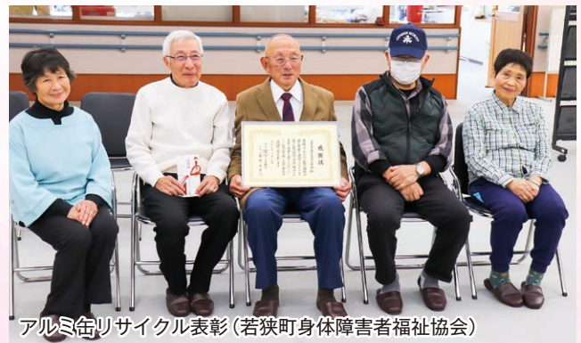
アルミ缶リサイクル表彰(若狭町身体障害者福祉協会)

本号の表紙写真の詳しい内容は、下記のQRコードを読み取って頂き、ぜひご覧ください。