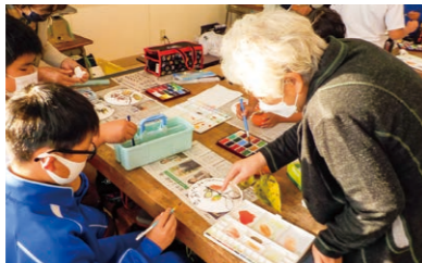
みそみ小学校(絵手紙交流)

自分たちの地域を少しでも良くしようと取り組んでいる団体や学校が行う福祉事業に助成しました。