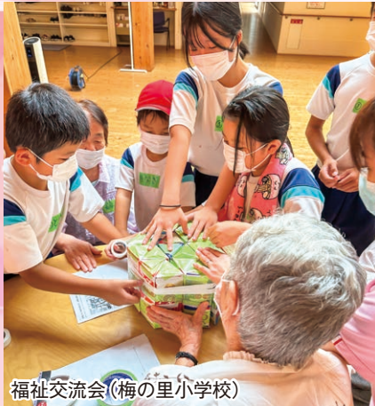
福祉交流会(梅の里小学校)