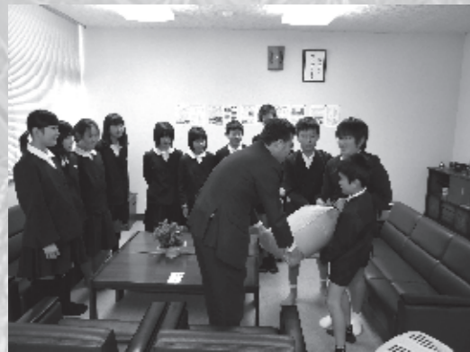
野木小学校のみなさん