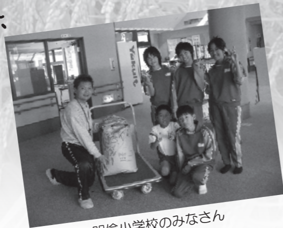
明倫小学校のみなさん