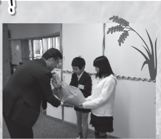
三宅小学校のみなさん

デイサービスや支援ハウスでのお食事、配食サービスのお弁当に提供させていただきました。いつもにも増して心のこもったご飯の味に利用者様の笑顔をたくさん見せていただいています。